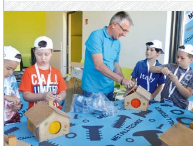
Wie fühlt sich Metall an, was kann man aus Holz machen, wie schneidet man Glas und wie funktioniert das eigentlich mit dem Strom – für die dritten Klassen der Volksschule Weiz gab es wieder viele spannende Stationen beim jobday 4 kids.